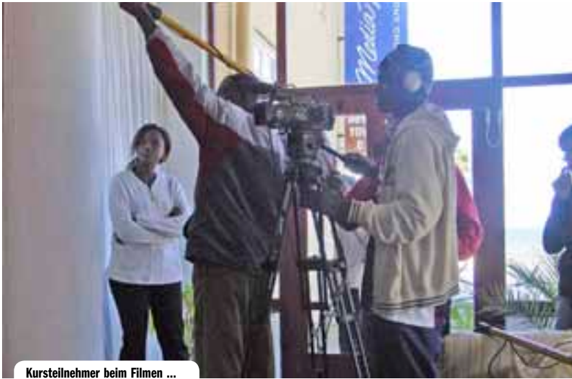
Kursteilnehmer beim Filmen ...