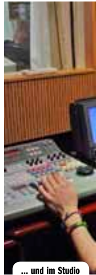
... und im Studio

Trotz Nebel, Kälte und Regen kann ich Gott nur dankbar sein, denn in den vergangenen Wochen hat er mich durchgetragen und ermutigt.