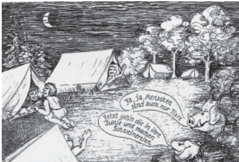
Zeichnung von Fritz Uhlig,

Ihr Bergesellen denkt daran, wie jedes Jahr wir zünden an das Feuer nach der Tradition, die die Germanen kannten schon. Wenn lodernd die Flamme zum Himmel schlägt, unser Brauch die Geister der Berge bewegt.