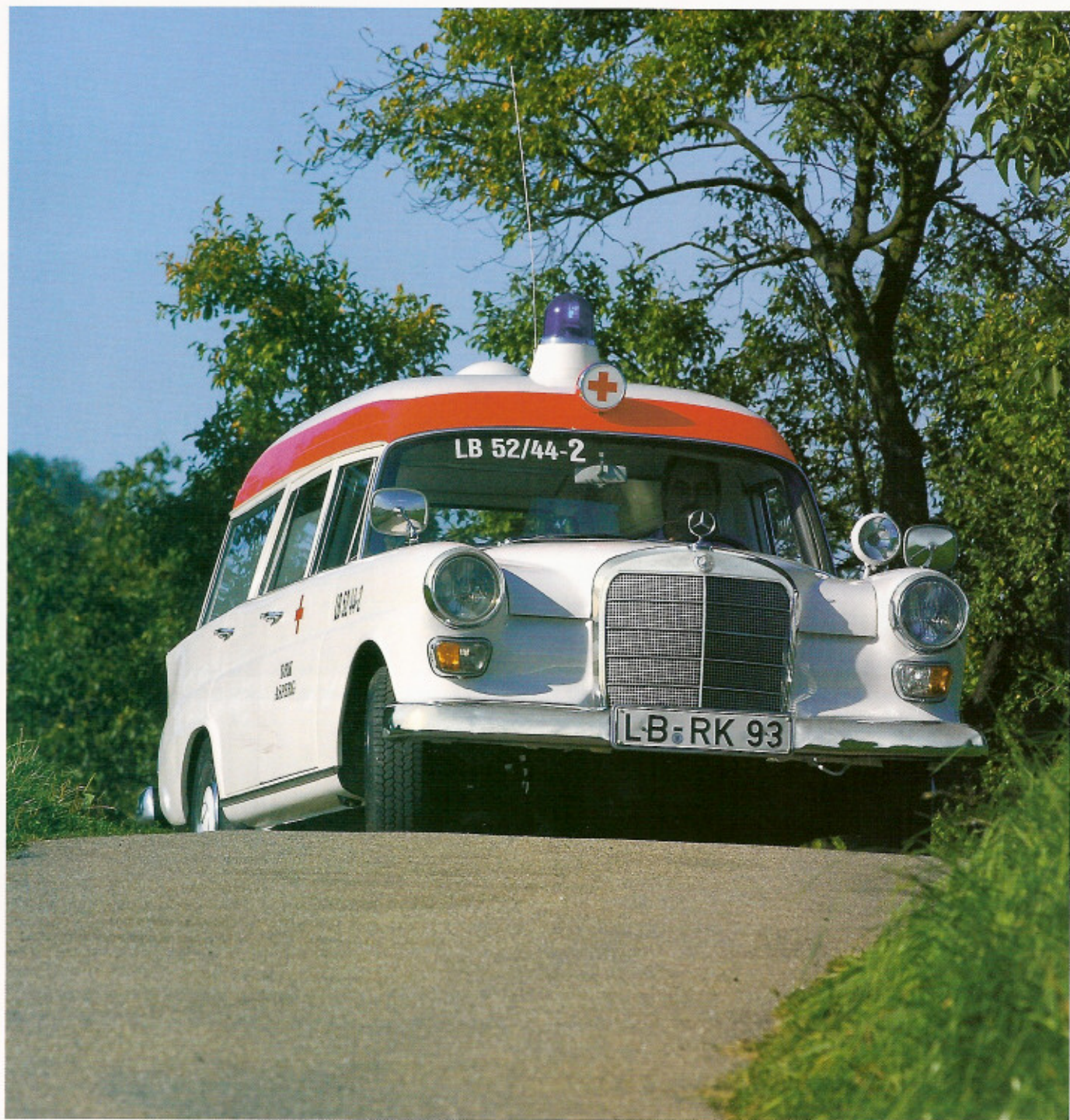
Mercedes-Benz 190c Binz-Ambulanz Europ 1000: Die Zusatzleuchten mit Blinker stammen von den 1965 bis 1968 gebauten Modellen (200, 200 D, 230)

Zugegeben, ein Krankenwagen bringt wenige Menschen zum Schwärmen. Daran mag es liegen, dass nur eine geringe Zahl dieser Autos zu Oldtimern reifte. Im schwäbischen Asperg versieht ein Mercedes-Benz beim DRK treu seinen Dienst – so gut gepflegt, dass er auch zu Filmaufnahmen gerufen wird.