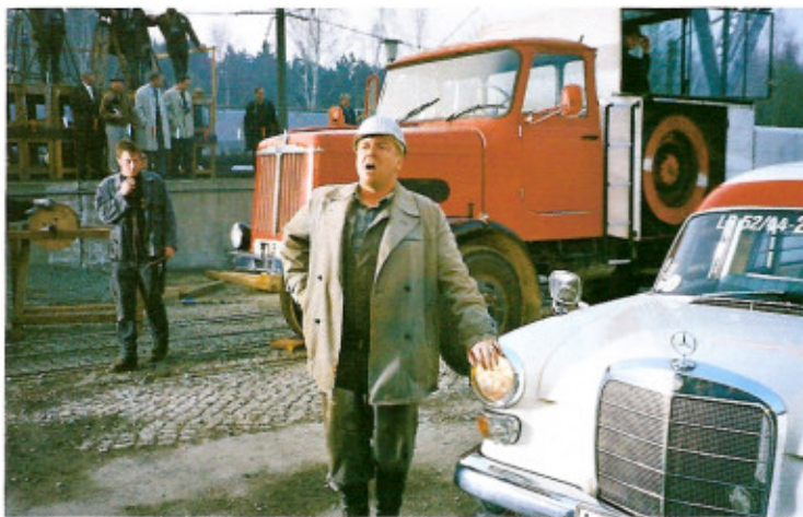
Film-Star: Mit Schauspieler Armin Rohde am Set von „Das Wunder von Lengede“

Im niedersächsischen Lengede kämpfen Bergleute in einem kollabierten Stollen um ihr Leben. Großalarm! Das Rote Kreuz rückt mit zahlreichen Krankenwagen, darunter eine Mercedes-Benz 190 Binz-Ambulanz Europ 1000 mit Ludwigsburger Kennzeichen, zur Rettung an.