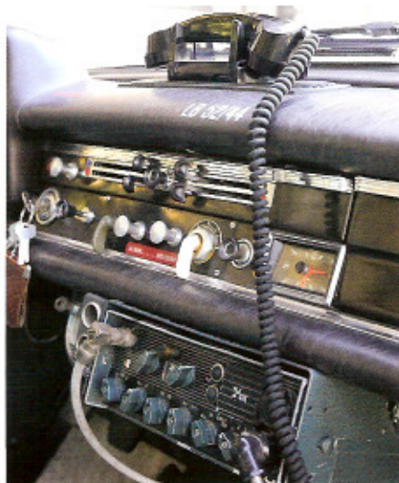
Sprechfunk mit altemodischem Telefonhörer

Der fünfstellige Kilometerzähler gibt keinen Aufschluss über die Laufleistung des Asperger DRK-Klassikers. Doch mehr als die angezeigten knapp 60.000 Kilometer dürften es nicht sein: Der Motor springt prompt an und verfällt in einen säuselnden Leerlauf. Die Mechanik des Antriebs erfreut sich bester Gesundheit, einzig dem Blech habe man jüngst seine Jahre angemerkt: „Der TÜV wollte einige Reparaturen an tragenden Teilen. So etwas kann schon zum Problem werden, denn wir müssen