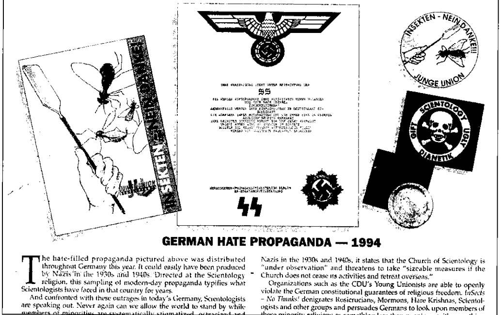
GERMAN HATE PROPAGANDA — 1994

Aus einer Scientology- Kampagne in den USA, in der die Junge Union Deutschlands angegriffen wurde.