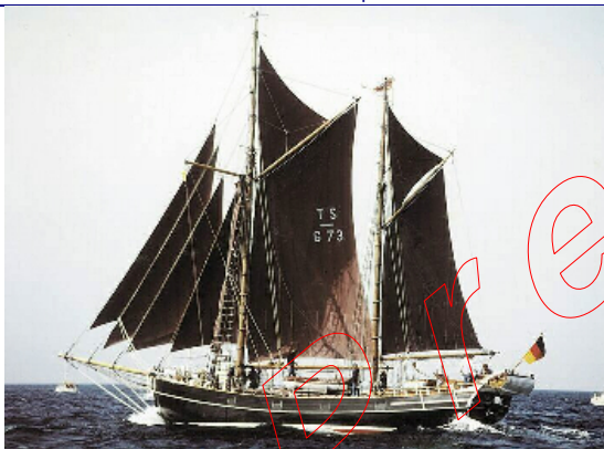
Marstalschoner "Zuversicht" (BJ: 1905, LüA: 30m), Kiel.