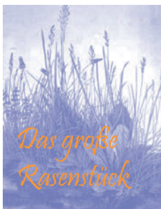
Das große Rosenstück

Doch da kommt ein berühmter Maler daher, Albrecht Dürer, und zeichnet ein schlichtes Allerweltsstück Wiese. Er zeichnet, was er sieht, oder was er sich als Wiese vorstellt. Denn bis heute haben die Forscher noch nicht herausbekommen, ob Dürer ein echtes Stück Natur malte oder eines, das er sich nur vorgestellt hat.