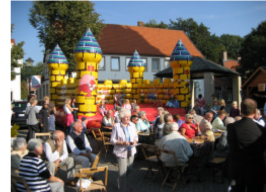
Erntedankfest auf dem Mühlenplatz, September 2009

Weihnachtsmärkten und anderen Festen trommelte das „Orgelwerk“ für das neue Instrument.