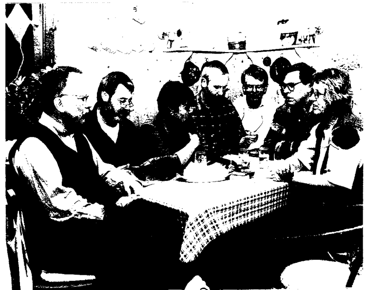
Der „harte Kern“ der „Aktion Regelmäßig“ trifft sich einmal im Monat.

Die Aktion hatte soviel Erfolg, daß zwei Jahre später ein Verein gegründet wurde. „> des Mitglied überweist seither monatlich auf das AR-Konto einen selbst festgelegten Betrag. Weitro Freund und Bekannte wurden für die Idee gewonnen“, umschreibt Dörn-