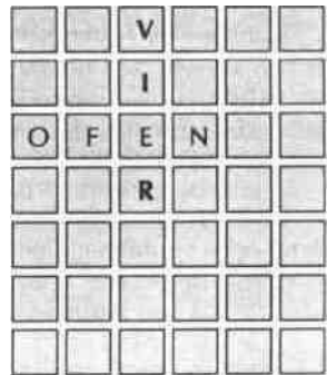
Zug 2 - Wert 9