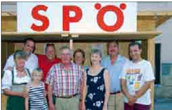
Am Stand der SPÖ-Gablitz trafen sich viele Gablitzerinnen und Gablitzer.

Gablitz feierte beim 18. Dorffest das 30-jährige Jubiläum seiner Markterhebung. Neben viel Musik, Ringelspiel, Luftburg, Clowns, Märchenerzählern, einer Stelzengeherin usw., gab es, sozusagen als krönenden Abschluss, ein imposantes Feuerwerk.