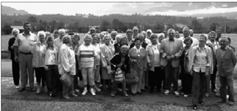
Die Freunde der SPÖ-Gablitz verbrachten den Sommerurlaub in Tirol – vom Hotel aus sah man den Wilden Kaiser.

Viele Ausflüge in die nähere und weitere Umgebung führten natürlich nach Kitzbühel und St. Johann, rund um den Wilden Kaiser, Kufstein, Krimmler Wasserfälle, Mayerhofen und das Zillertal, Wasserburg am Inn (Bayern), Chiemsee usw., usw. Natürlich kamen auch unsere Wanderer auf die Rechnung, es gab einen Tag mit „Hüttengaudi“, Radausflüge, Entspannung im Vitalcenter mit Schwimmbad und Saunalandschaft, einen Tanz- und Unterhaltungsabend mit Live-Musik und einiges mehr.