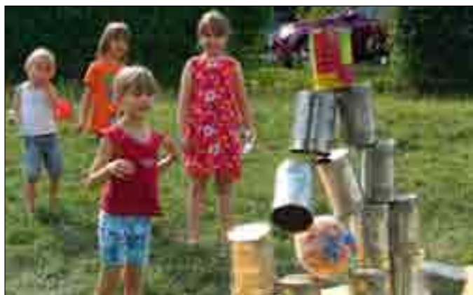
Eine der Disziplinen war das beliebte Dosen schießen.