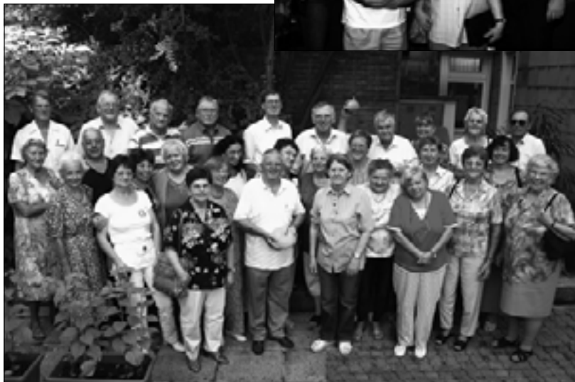
Nach der Kürbiscremesuppe stellten sich die gekommenen Mitglieder des Gablitzer Siedlervereins zum Erinnerungsfoto.

6. Oktober Mostpressen im Hausergraben (Grundstück Linzer Straße - Anton Hagl Gasse) und Teilnahme am Gablitzer Advent vor der Pfarrkirche.