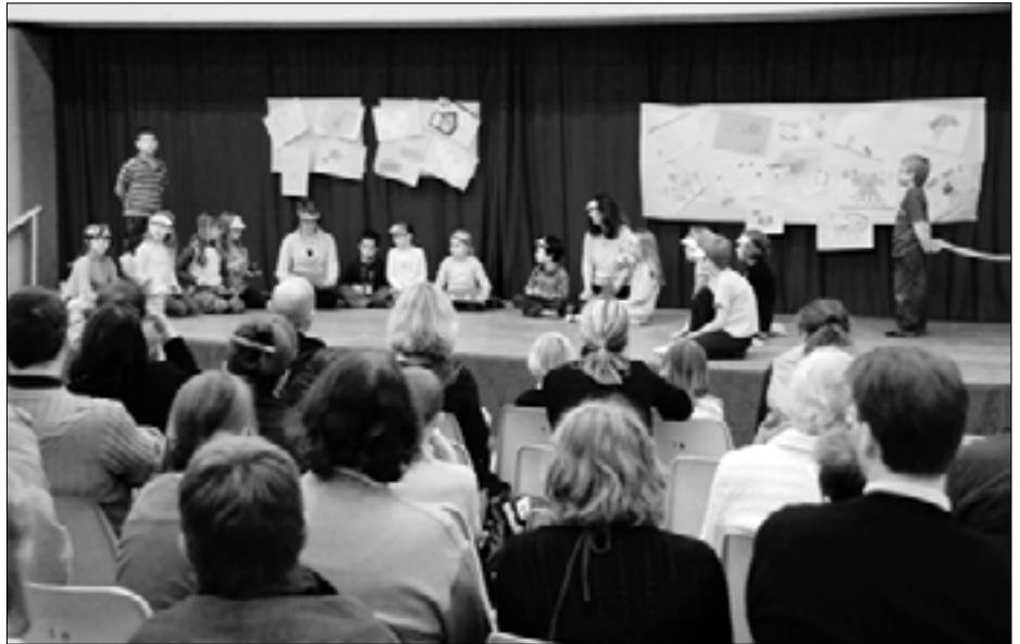
Die Eröffnung der Kulturtage erfolgte mit der Kindergruppe des Musikvereins und der Jugendtanzgruppe „Dancing Socks“ vom Gablitzer Turnverein.