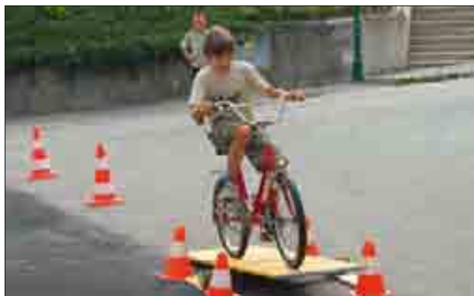
Hier ist Balance gefragt...