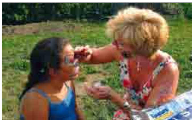
Wie auch bei den bisherigen Spielefesten der SPÖ-Gablitz war bei den Kindern das Schminken sehr beliebt.