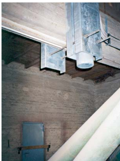
Bild 1: Stahlkonstruktion einer Mobilfunkantenne in einem Silo mit Ex-Umgebung in unmittelbarer Nähe einer Elektroinstallation

In landwirtschaftlichen Betrieben findet man häufig auch verrostete Fangeinrichtungen und Ableitungen vor – was sich im Prinzip einfach kontrollieren lässt. Schwieriger gestaltet sich hingegen die Kontrolle der Erdungsanlagen, welche somit häufig die Ursache für Schäden bilden. Der Zustand und die Beschaffenheit von Erdungsanlage sowie deren Verbindungen – mit einem Alter von mehr als zehn Jahren – müssen gemäß [1] durch punktuelle Freilegungen beurteilt werden. Bei Schadenbeurteilungen entdecken Sachverständige häufig, dass Er-