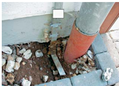
Bild 2: Diese »Mogelpackung« muss als grobe Fahrlässigkeit seitens des Installationsbetriebs angesehen werden

Weiterhin findet man im Abschnitt 6.3.1 dieser Norm die Aussage: »Überspannungsschutzgeräte sind im allgemeinen erforderlich