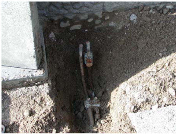
Bild 1 Ableitung und Erder unterhalb der Trennstelle sind kurzgeschlossen

Beispiel: Dabei kann man auch die „Verbesserungsmaßnahmen“ der vorherigen Blitzschutzbaufirma feststellen. Auf Bild 1 sieht man, dass die Installationsfirma der Erdungsanlage unterhalb der Trennstelle im Trennkasten noch eine Verbindung zwischen dem Erder und der Ableitung hergestellt hat. So hat die Installationsfirma einen guten „Erdungswiderstand“ für immer geschaffen, was jahrelang von einer Prüforganisation als guter Widerstand gemessen oder auch nicht gemessen wurde.