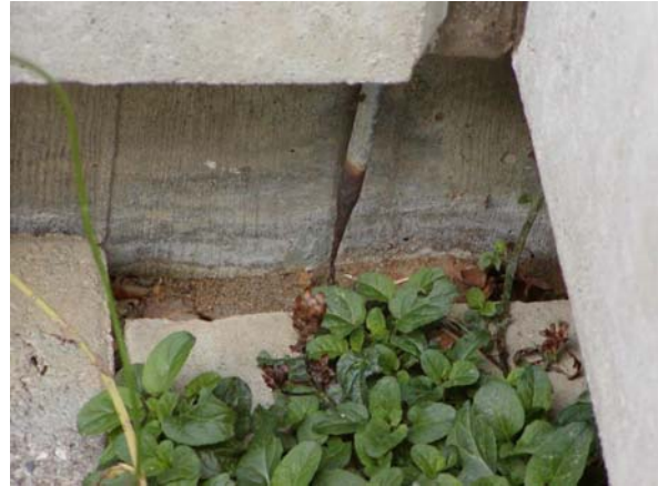
Bild 2 Durchgerostete Erdereinführung ohne Korrosionsschutz

Beispiel: Oben auf dem Dach waren die Trennstellen an der Blechkante verlötet. Dadurch wurde auf dem Dach, wie bei dem vorherigen Beispiel, nur der Schleifenwiderstand über die Blechkante gemessen. Die Austritte unten aus dem Erdbereich, die komplett durchgerostet waren, wurden nicht kontrolliert ( Bild 2 ).