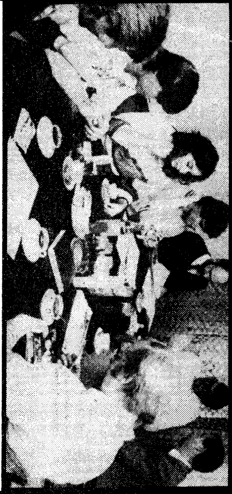
Programmsitzung im Stille großer Rundfunkanstalten: Radio Brenner

kaufkräftigste Bevölkerungsschicht ausmacht und Kaufkraft natürlich bei den von Werbespots abhängigen Privatstationen enorm wichtig ist. Ohne Werbespots kann kaum eine privatwirtschaftlich geführte Station überleben und so werden die Programme zielgruppengerechter gestaltet, zumal lautend Erhebungen durch Marktforschungsinstitute, die Einschaltquoten und Werbewirksamkeit überprüfen, statfinden.