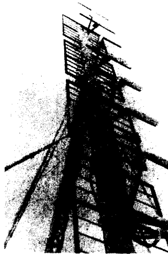
Antenne im Schneesturm

erhalten hatten: Neben M 1 versuchte es wenige Wochen später auch der von der Flatschspitze oberhalb des Brenners sendende Radio Brenner.