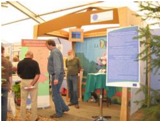
Burgwaldmesse 2007: Regionale und internationale Informationen....

Zur Burgwaldmesse erschien auch ein aktuelles zweisprachiges Informationsblatt mit dem aktuellen Verfahrensstand.