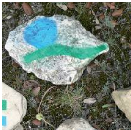
Die ausgewählte Grundlage für die Wegemarkierung.

Als internationales Wegmarkierungszeichen wurde die folgende Variante beschlossen: